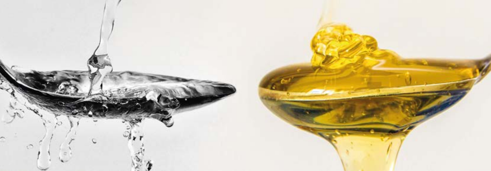
Viscositeit: de vloeistof links (water) heeft een veel lagere viscositeit dan de vloeistof rechts (honing).

Reinigers op waterbasis verwijderen vuil niet alleen door verontreinigingen op te lossen, maar gaan ook een chemische reactie aan met de verontreinigingen om ze gemakkelijker oplosbaar te maken in water. Belangrijke factoren die het oplosvermogen van waterige reinigers beïnvloeden zijn de toegevoegde additieven, de pH waarde en de temperatuur tijdens het proces.