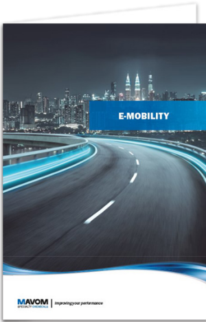
Raadpleeg onze E-mobility brochure

AC/DC omvormers, DC/DC converters en boordladers moeten bestand zijn tegen zware omstandigheden en mechanische belasting. Schok- en trilbestendigheid gedurende de hele levenscyclus van het voertuig zijn essentieel voor een veilige en betrouwbare stroom-conversie net als de chemische bestendigheid van de vermogenslektronica. Met een groot aanbod aan verschillende technologieën zoals inglietharsen en coatings om deze componenten te beschermen en thermal management producten om warmte af te voeren kan de duurzaamheid en betrouwbaarheid voortdurend verbeterd worden.